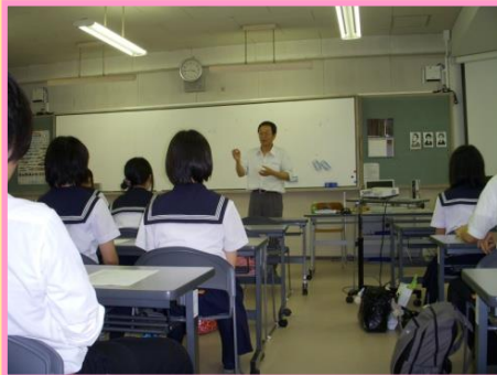
「講義 フィールドワークの重要性 京都大学 安藤和雄 教授」