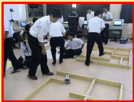
「LEGO ロボットを使った実習」