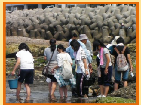
「校外学習 知多半島 荒磯松海岸の磯の観察」