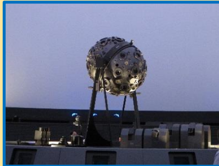
「校外学習 科学館 天文学の理解を深める」