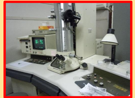
「名古屋市立大学大学院 研究室見学」