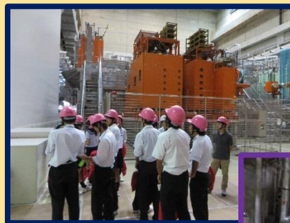
「校外実習 核融合科学研究所訪問」