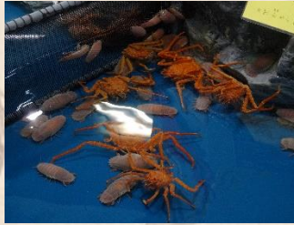
↑さわりんぷーるで深海生物とふれあう